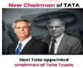
New Chairman of TATA Noeli Tata appointed Chairman of Tata Trusts

* ಟಾಟಾ ಗ್ರೂಪ್ ನ ಮಾಜಿ ಗೌರವಾನ್ವಿತ ದಿವಂಗತ ರತನ್ ಟಾಟಾ ಅವರ ಮಲ ಸಹೋದರ ನೋಯೆಲ್ ಟಾಟಾ ಅವರು ಟಾಟಾ ಟ್ರಸ್ಟ್ ನ ಅಧ್ಯಕ್ಷರಾಗಲಿದ್ದಾರೆ. ಟಾಟಾ ಟ್ರಸ್ಟ್‌ನ ಹೊಸ ಉತ್ತರಾಧಿಕಾರಿಯಾಗಿ ನೋಯೆಲ್ ಟಾಟಾ ಅವರನ್ನು ಅವಿರೋಧವಾಗಿ ಅಕ್ಟೋಬರ್ 11 ರಂದು ಆಯ್ಕೆ ಮಾಡಲಾಯಿತು.